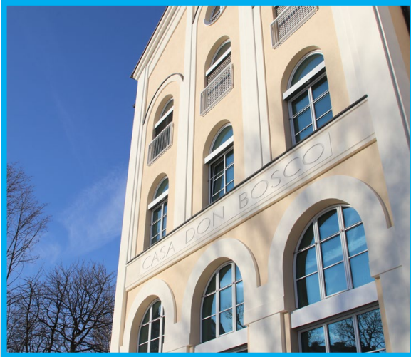
Informations- und Beratungsstelle in München, Au-Haidhausen